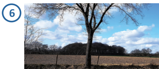
Solarpark nicht einsehbar