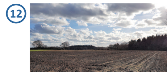
Solarpark nicht einsehbar

Gemeinde Groß Vollstedt Bebauungsplan Nr. 11 und 2. Änderung des Flächennutzungsplans