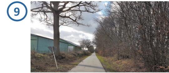
Solarpark nicht einsehbar