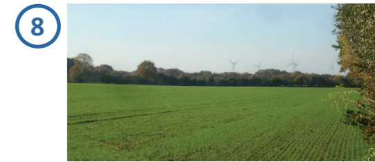
Solarpark nicht einsehbar