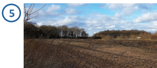
Solarpark nicht einsehbar