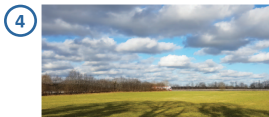
Solarpark teilweise einsehbar