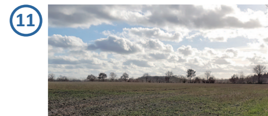
Solarpark nicht einsehbar