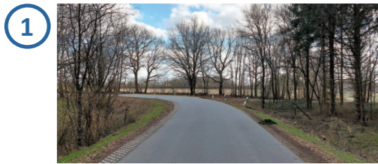
Solarpark teilweise einsehbar