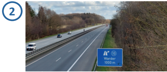
Solarpark teilweise einsehbar