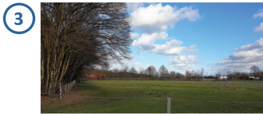
Solarpark teilweise einsehbar