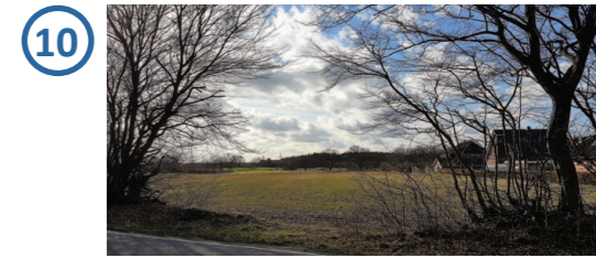
Solarpark nicht einsehbar